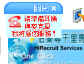
延攬海外人才網站